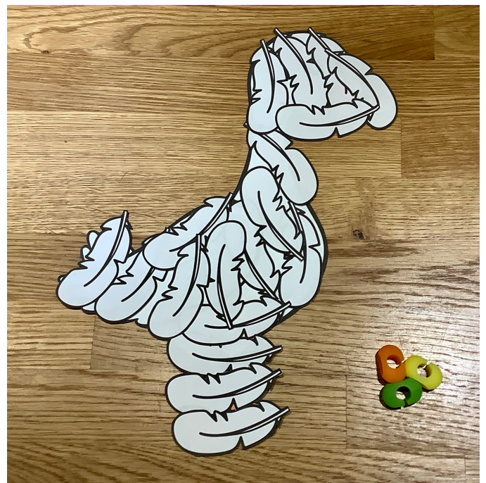
Tip 1. Dechové cvičení