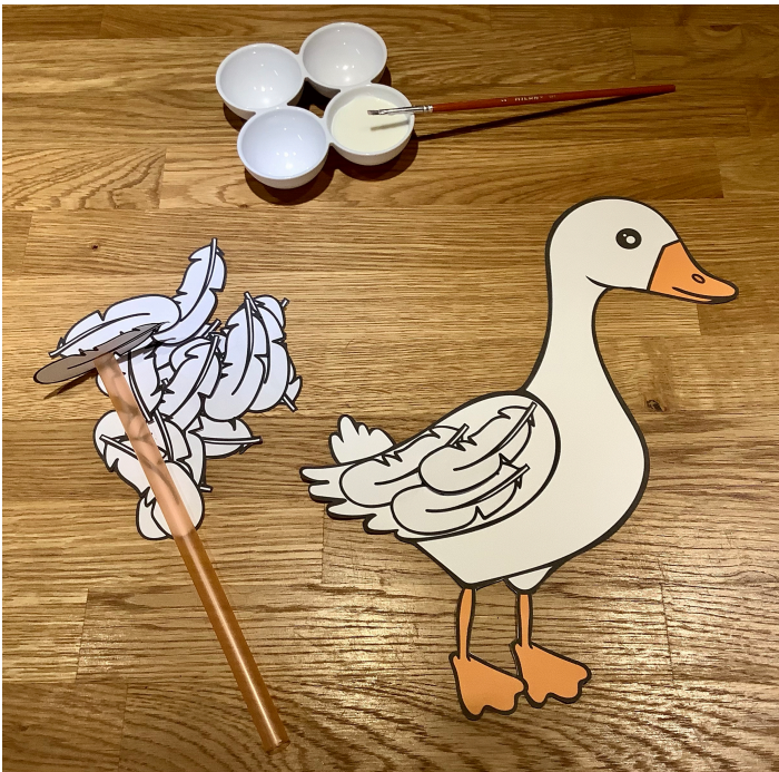
Barevná husa s peříčky